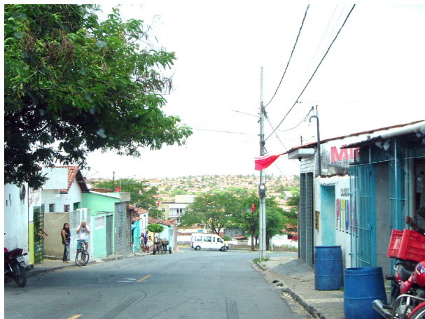
Imagem 02: Uma das ruas principais do bairro, onde o hábito das “conversas de calçada” são comuns